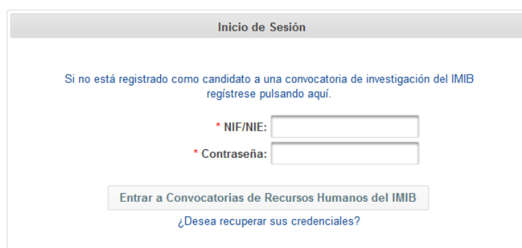
Ilustración 1. Acceso a la plataforma de convocatorias de investigación.

La página principal de acceso a la aplicación de convocatorias de investigación de recursos humanos del IMIB-Arrixaca se encuentra en el siguiente enlace: http://www.convocatorias.imib.es/