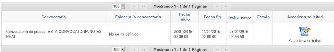
Ilustración 6. Mis solicitudes.